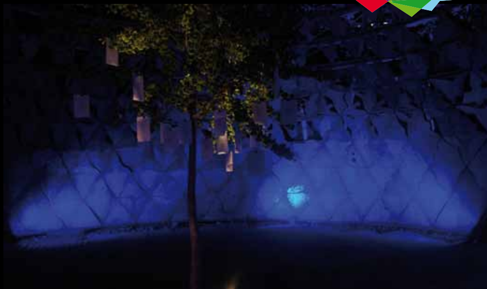
L'Ultime Matière - installation lumière par Juan Velasquez et ses étudiants de l'atelier Espace et Lumière - automne 2011

Fondée en 1865, la plus ancienne des écoles d'architecture en France accueille aujourd'hui plus de mille étudiants. Pionnière dans l'enseignement de l'architecture mais aussi dans les domaines de la recherche, des coopérations internationales et de la diversification culturelle, ce n'est pas un hasard si l'École Spéciale s'inscrit désormais au rang des Grandes Écoles.